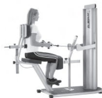
Stabilisation im Sitzen

Erlernen der gezielten Ansteuerung der Muskeln M. transversus abdominis und M. multifidus lumbalis .