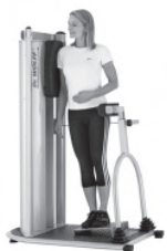
Training der lateralen Rumpf-Muskulatur

Erlernen von Kombinationsübungen für Haltungsstabilisierung und Bewegungsmuskulatur.