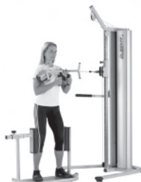
Training der Rotation