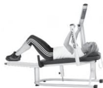
Zielgerichtetes Training des M. transversus

Optimierung und Aufbau der haltungsstabilisierenden Muskeln in unterschiedlichen Bewegungsebenen.