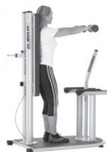
Stabilisation im aufrechten Stand

Übertragung der erlernten Stabilisation auf Alltagsbewegungen.